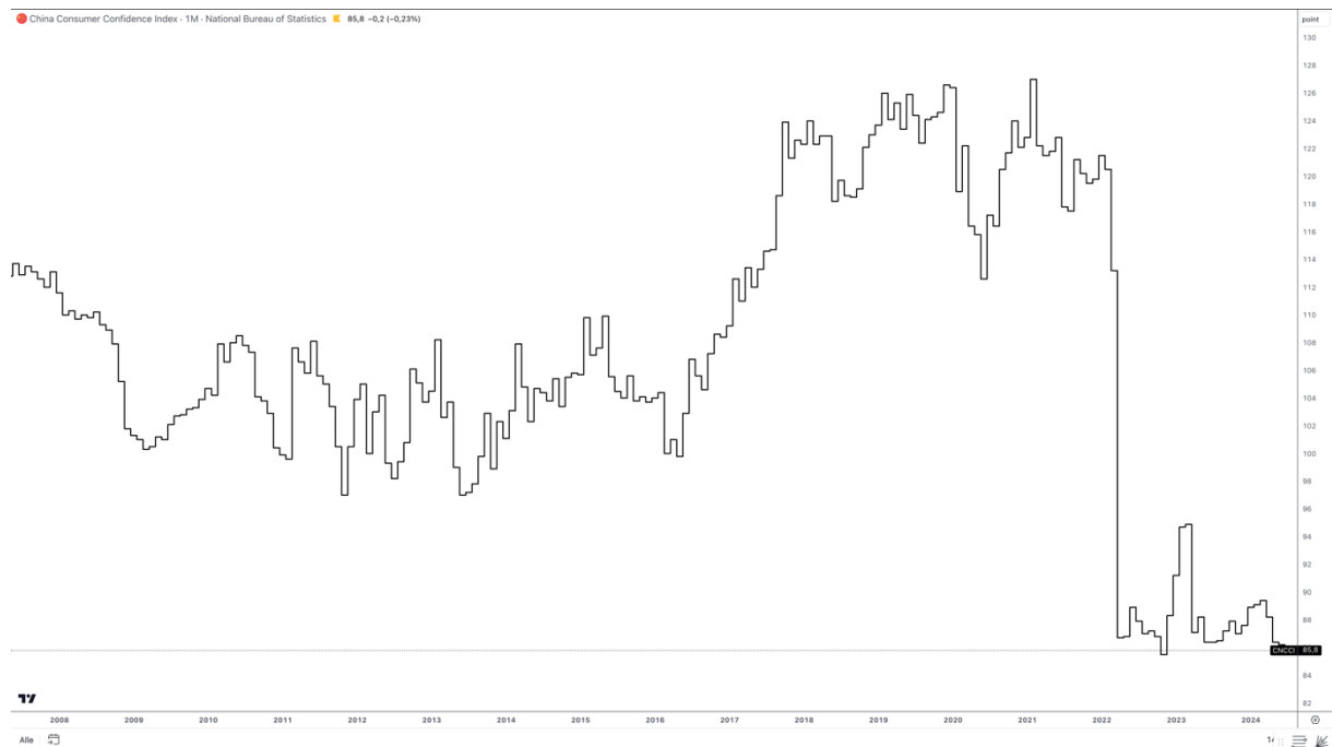
China Consumer Confidence Index

Währenddessen zeigt sich in den Zahlen der Moncler S.p.A. und der Hermès International SCA bisher keine nachhaltige Erholung in den Umsätzen im Festlandchina.